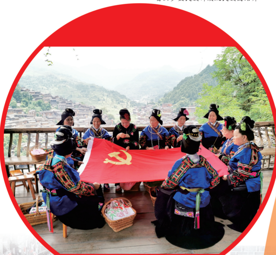
苗族群众感党恩绣党旗