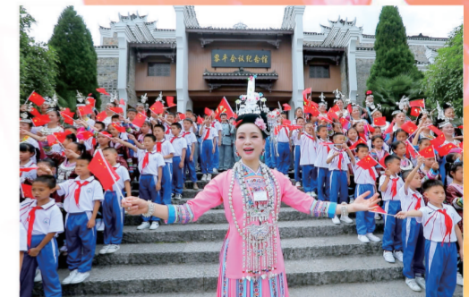
黎平会议纪念馆前倾情演唱