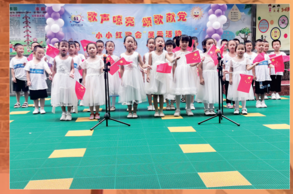
从江丙妹镇中心幼儿园的孩子们参加红歌传唱