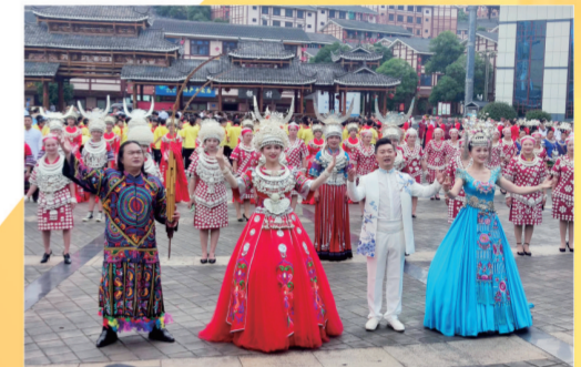
凯里市广大群众高歌颂党恩