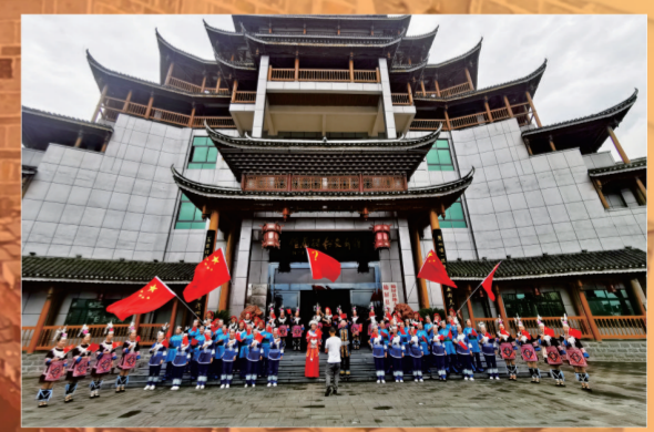
苗侗儿女唱响心中的美好旋律