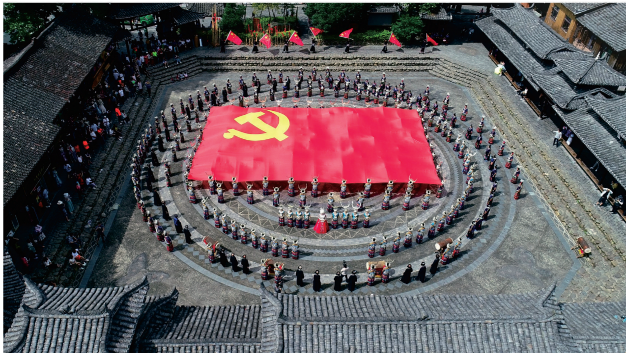
雷山少数民族群众跳民族团结舞

百年征程波澜壮阔,百年初心历久弥坚,百年精神代代相传。在伟大的中国共产党成立100周年之际,我州各族人民群众满怀激情,热情讴歌党的光辉历程和丰功伟绩,用真挚的歌声抒发最深切的爱党之心、爱国之情,深情表达知党、爱党、信党、矢志不渝跟党走的坚定信念和奋斗情怀。在歌声中感悟信仰的力量,在传唱中激发奋斗的热情,发扬党的光荣传统,传承党的红色基因,不忘初心、牢记使命,奋力谱写全面建设社会主义现代化国家的新篇章。