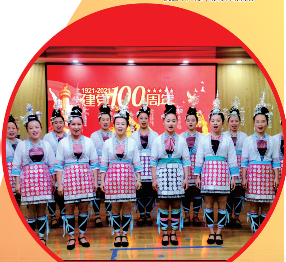
侗族群众讴歌党的百年华诞