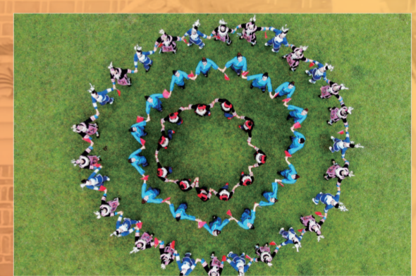
锦屏少数民族群众载歌载舞庆祝党的百年华诞