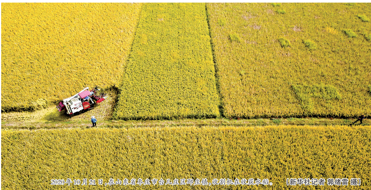
2020年10月21日,在山东省枣庄市台儿庄区碾庄镇,收割机在收获水稻。