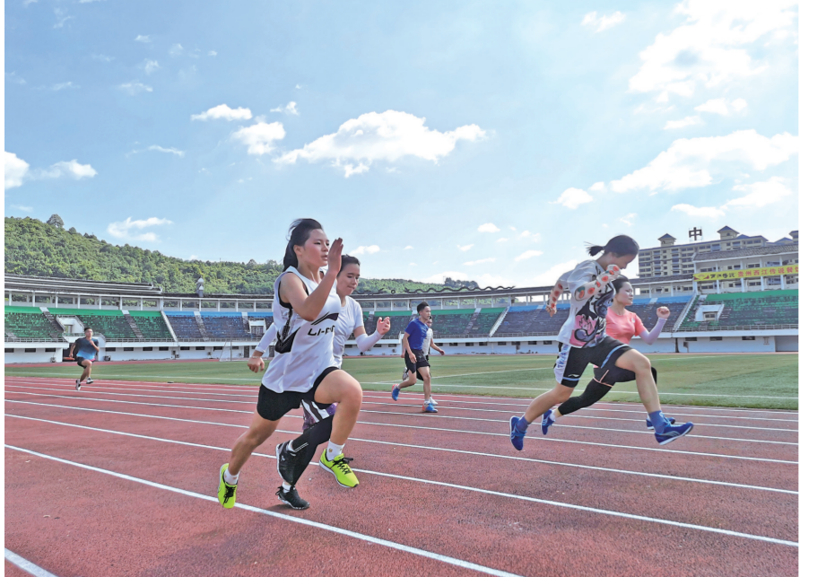
州十运会暨第四届民运会进入倒计时。连日来,天柱县参加比赛的运动员们顶着炎炎烈日,不畏酷暑,在阳光