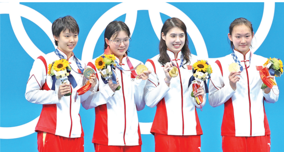
7月29日，中国队选手杨浚瑄、汤慕涵、张雨霏、李冰洁（从左到右）在颁奖仪式上。当日，在东京奥运会游泳女子4X200米自由泳接力决赛中，由杨浚瑄、汤慕涵、张雨霏、李冰洁组成的中国队打破世界纪录并夺冠。