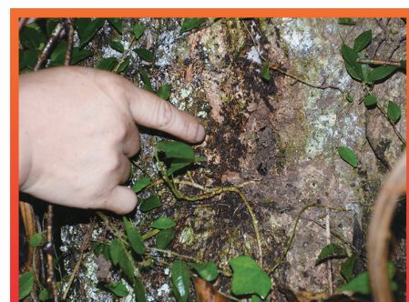
战壕旁麻栗树上的疑似弹洞