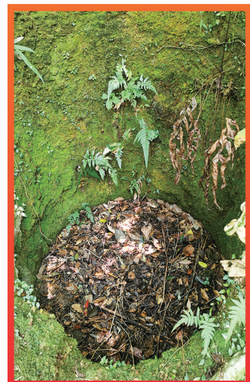
后甘岭红军战斗遗址