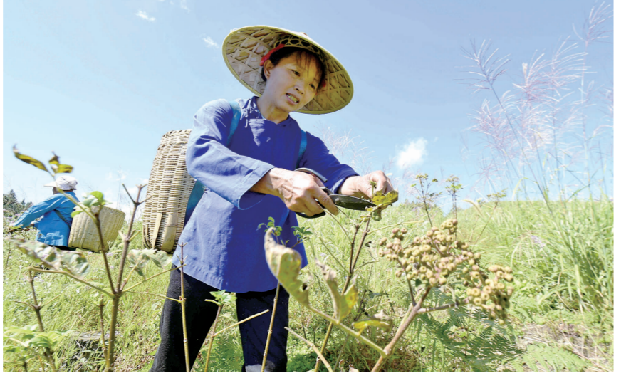
眼下,锦屏县平秋镇晓岸村种植的吴茱萸进入收获季。村民忙着采收、搬运、晾晒吴茱萸,一派丰收的繁忙景象。2020年,在当地政府和驻村工作队等多方力量的帮助和支持下,晓岸村成立吴茱萸种植专业合作社,目前,共种植吴茱萸130多亩,群众通过入股分红、就近务工等方式实现增收。图为村民在采收吴茱萸。

行线上销售,线下,公司则出售山核桃果实到浙江一带。据企业负责人介绍,在政府部门的帮助下,公司还通过知名网络主播带货的方式销售山核桃,打开了更为广阔的销路,每年产值有1000多万元。据了解,锦屏县金森山核桃综合开发有限公司成立于2017年,是一家主要以当地野生山核桃以及人工种植的薄壳山核桃、小核桃产品为主打品牌的农特产品公司。公司目前有野生山核桃基地5000亩,年产量300吨,薄壳山核桃种植基地1500亩,小核桃基地2000亩。公司成立至今,以“公司+合作社+农户”的模式,已经带动260户建档立卡户增收致富。