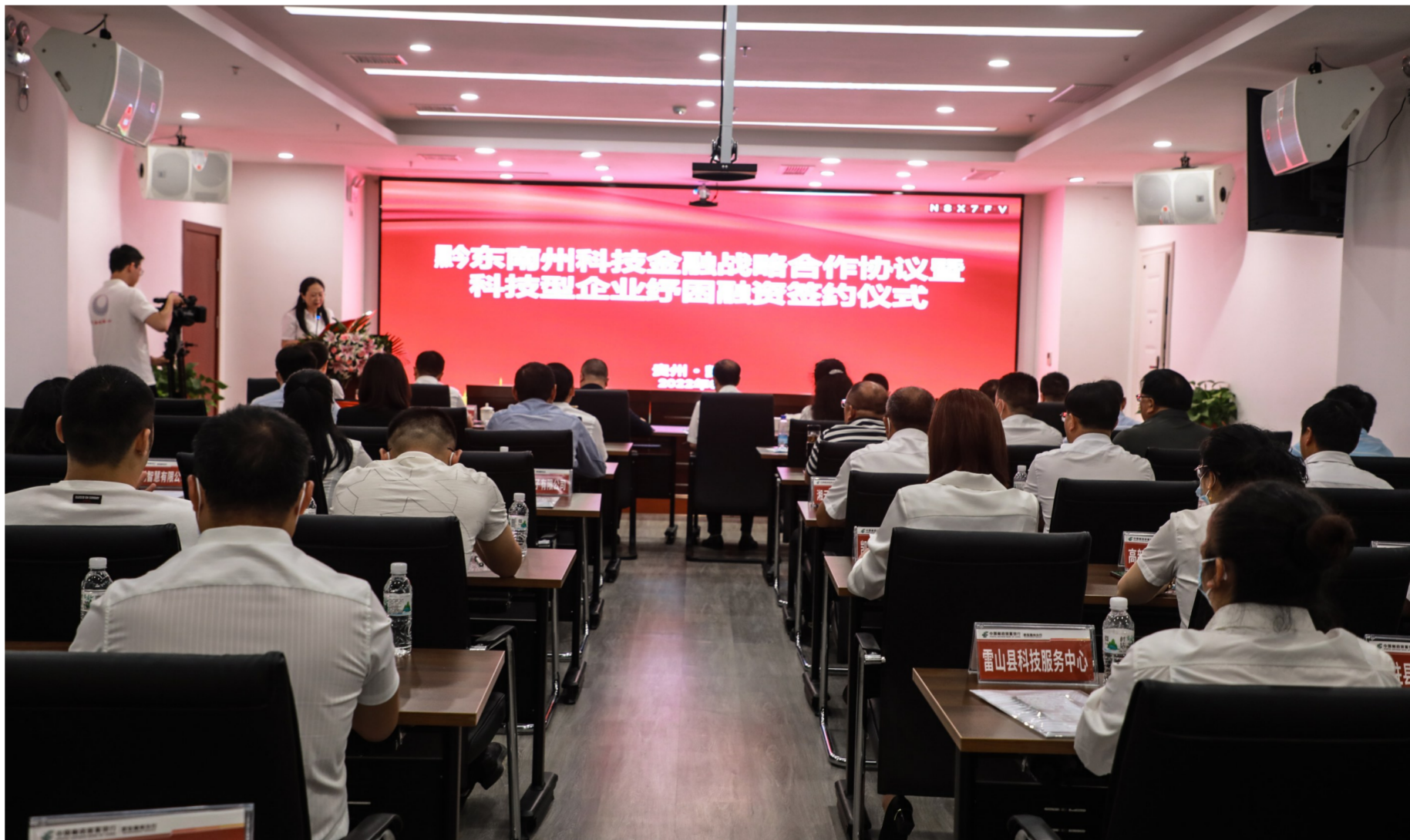
2022年6月,黔东南州科技局、州金融办、邮储银行黔东南州分行成功签订《科技金融战略合作协议》。