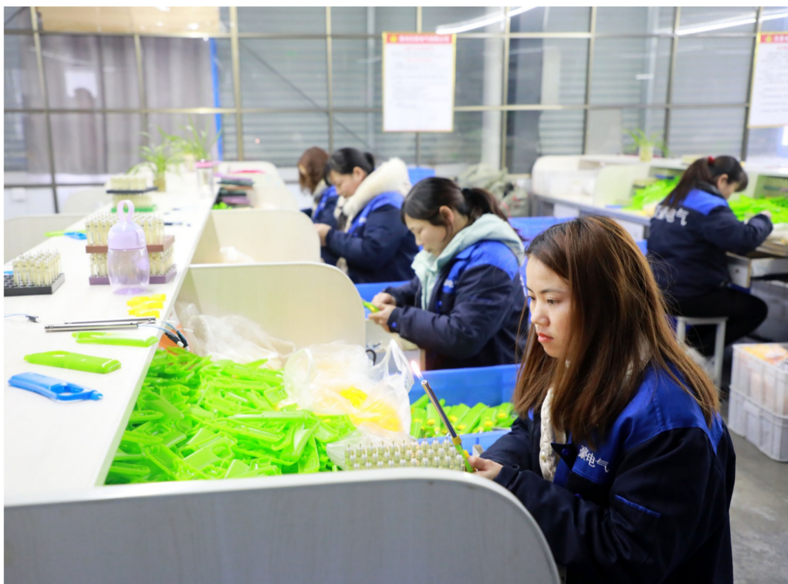
邮储银行贷款支持的岑巩县工业园区某打火机企业生产车间工人正在测试组装好的打火机

此外,贵州兴宇涵电气制造公司、贵州岑祥源源科技公司等多家企业通过申请科技企业入库后均获得了邮储银行科技信用贷款支持,邮储银行黔东南州分行通过“融资+融智”让企业搭上解忧纾困直通车。