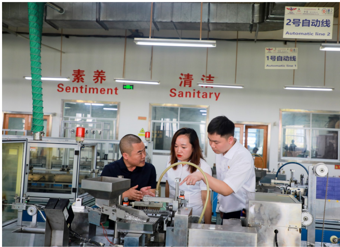
邮储银行黔东南州分行客户经理走访贵州凯里经济开发区某电子公司