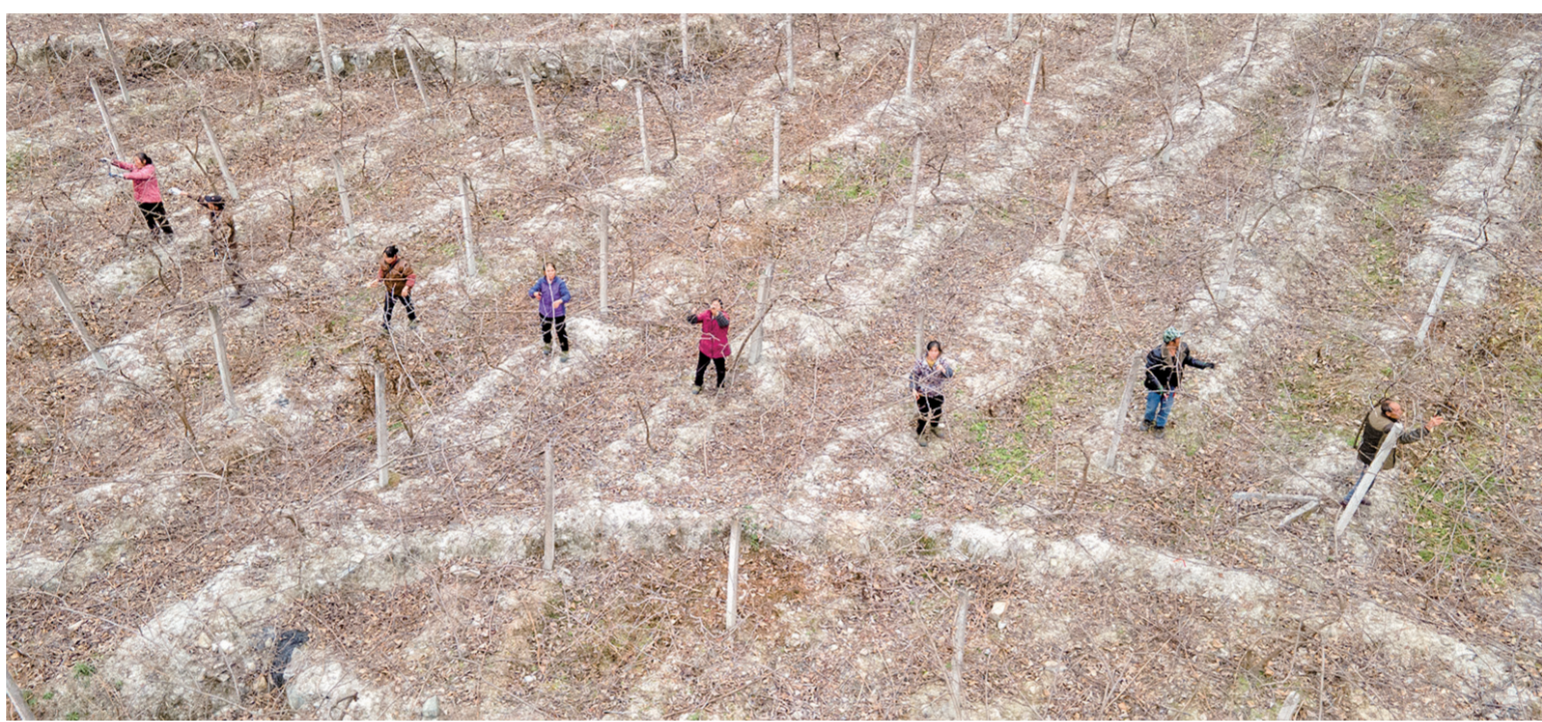
近年来,岑巩县平庄镇依托良好的生态资源优势,按照“党支部+大户”的模式,大力发展经果林。包东村猕猴桃基地始建于2015年,基地面积120余亩(1亩=0.0667公顷),年均产量在8万公斤,有效带动15户群众务工,实现户均年增收8000元以上。

制定工作细化方案。从河流整体性和流域系统性出发,强化体制机制法治管理,大力复苏河湖生态,推动各级河湖长和相关部门履职尽责,制定《黎平县河湖长制2022年度工作细化方案》,划分7大工作任务,细化了42项具体工作