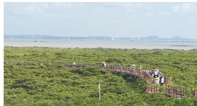
媒体记者参观红树林