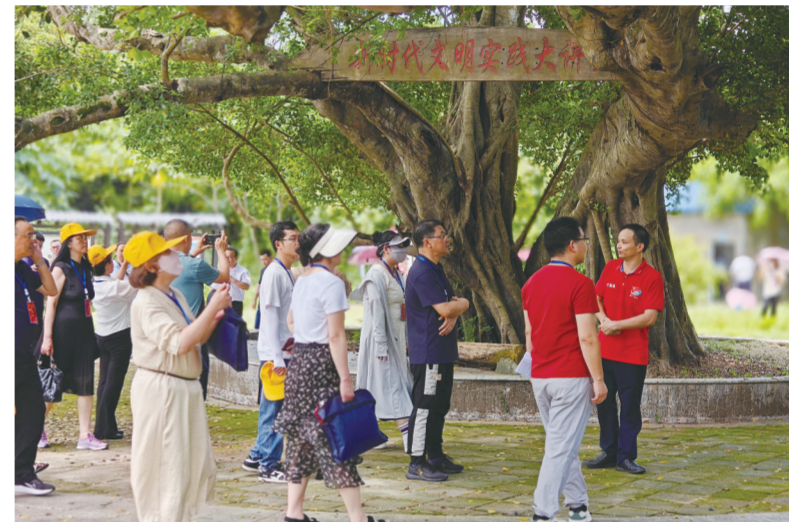
参观山新村

此外,防城港市积极推进市域社会治理现代化,建成全国第一批市域社会治理现代化试点城市,推动成立防城港市铸牢中华民族共同体意识法律服务中心、志愿服务队和民族贸易促进会等社会组织,架起民族团结“连心桥”。打造系列基层治理、守边固边“防城港样板”,依法保障各族群众合法权益,依法打击违法犯罪行为,搭建特色司法服务平台,助力民族团结边疆稳固。