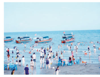
金滩旅游