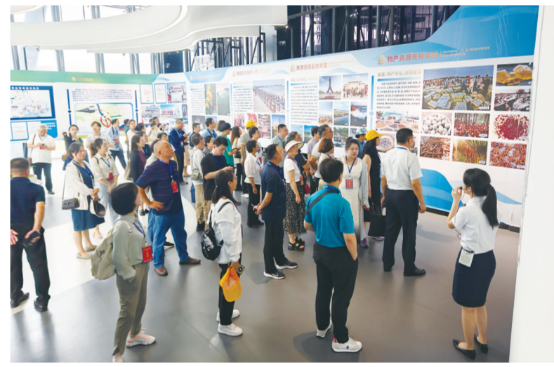
媒体记者参观防城港城市之窗