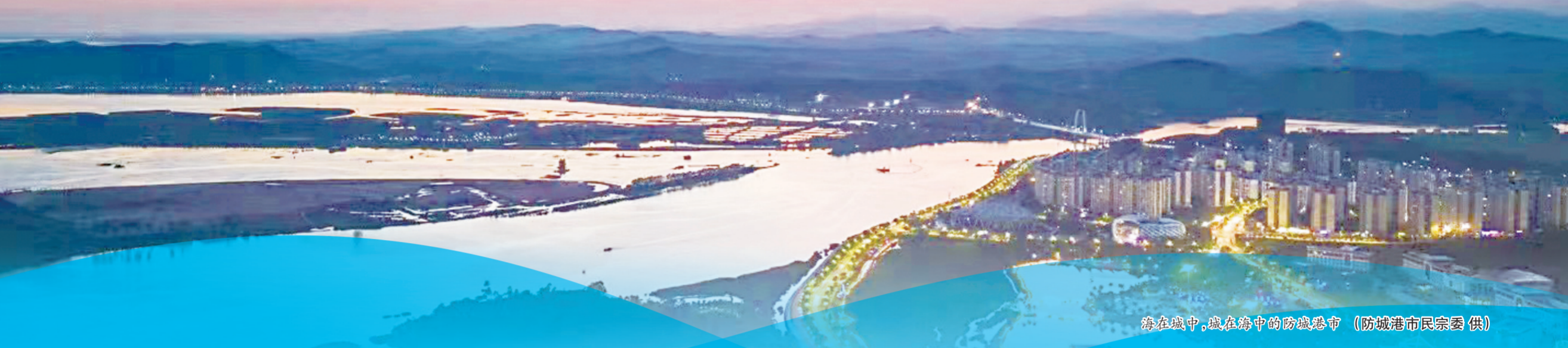
海在城中,城在海中的防城港市

防城港市作为全国仅有的两个“既沿海又沿边”的城市之一,是我国唯一与东盟海陆河相连的城市,也是一个多民族聚居的边疆民族地区。近年来,该市聚焦“五个家园”,通过“五融促共建”工作模式,推进铸牢中华民族共同体意识示范区建设,2024年1月获评“全国民族团结进步示范区”。