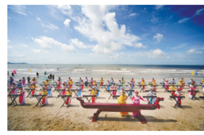
百人齐奏独弦琴