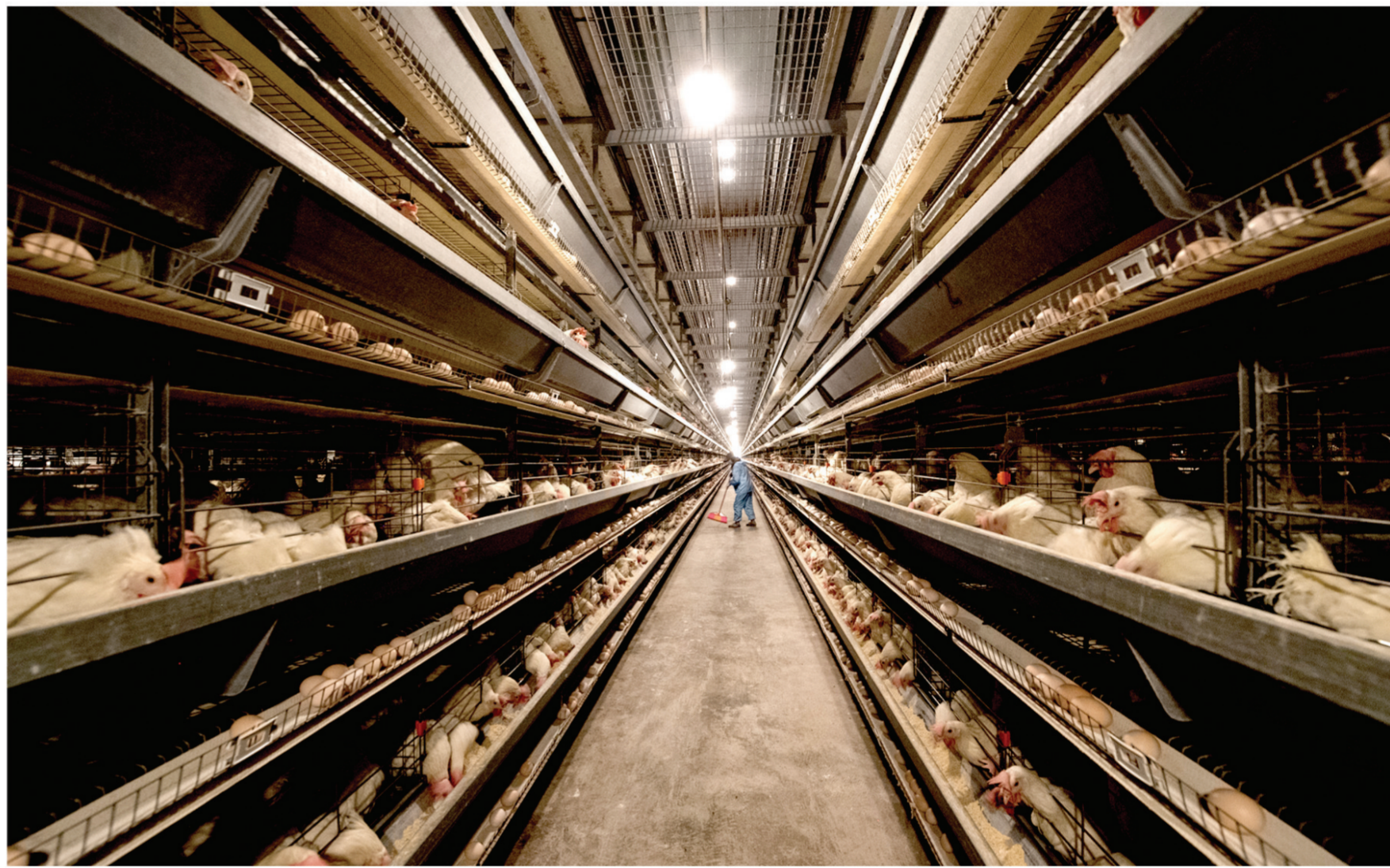
天柱县“凤玖玖”蛋鸡养殖场

质朴的地方特产,到闪耀科技光芒的“特色品牌”,天柱县以独特的发展视角,在细微处发力,实现了产业的“华丽蝶变”。物联网技术打破传统养殖的壁垒,科研实践深入田间地头,天柱县这条由科技创新开辟的乡村振兴新航道,为县域经济转型注入了全新活力。