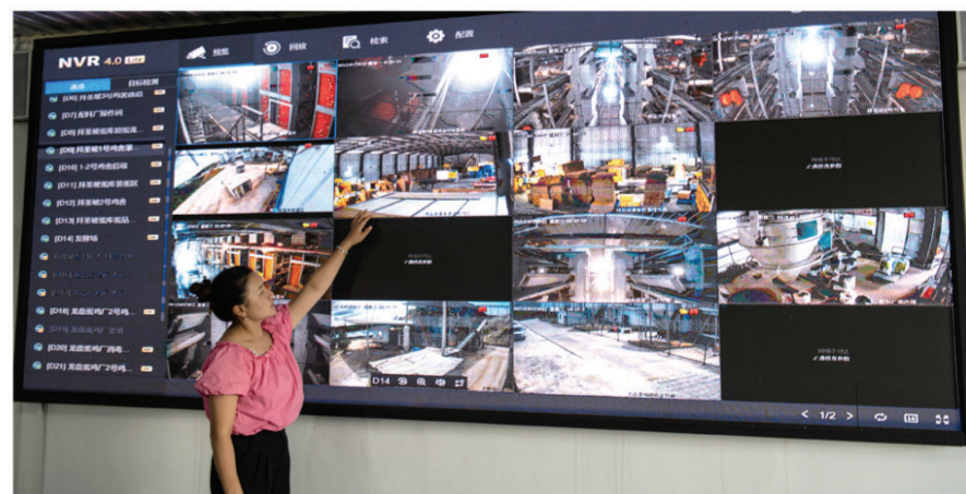
技术员在查看养殖场监控