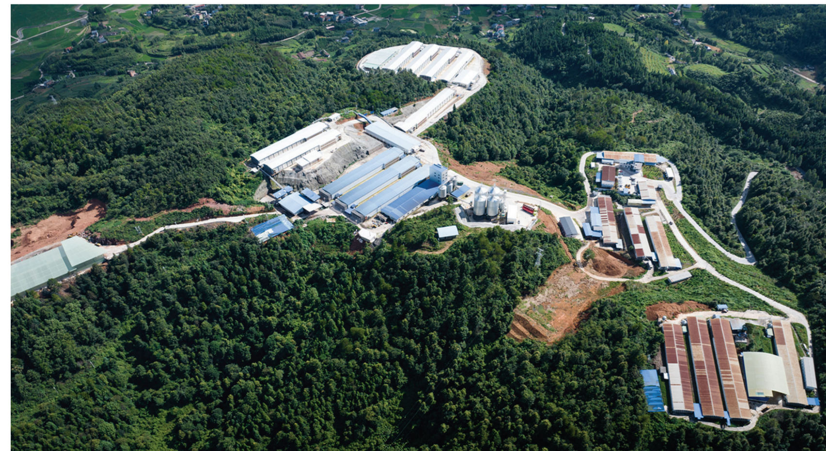
航拍天柱县“凤玖玖”蛋鸡养殖场全景