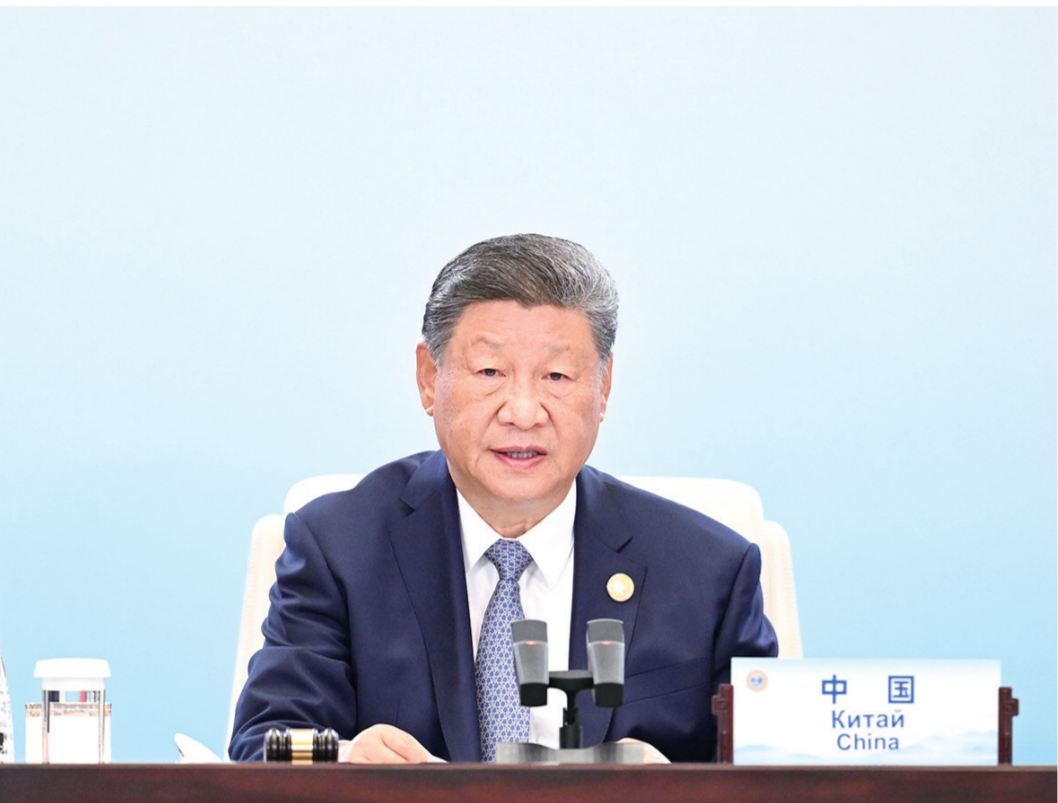
9月1日上午，上海合作组织成员国元首理事会第二十五次会议在天津梅江会展中心举行。中国国家主席习近平主持会议并发表题为《牢记初心使命 开创美好未来》的重要讲话。