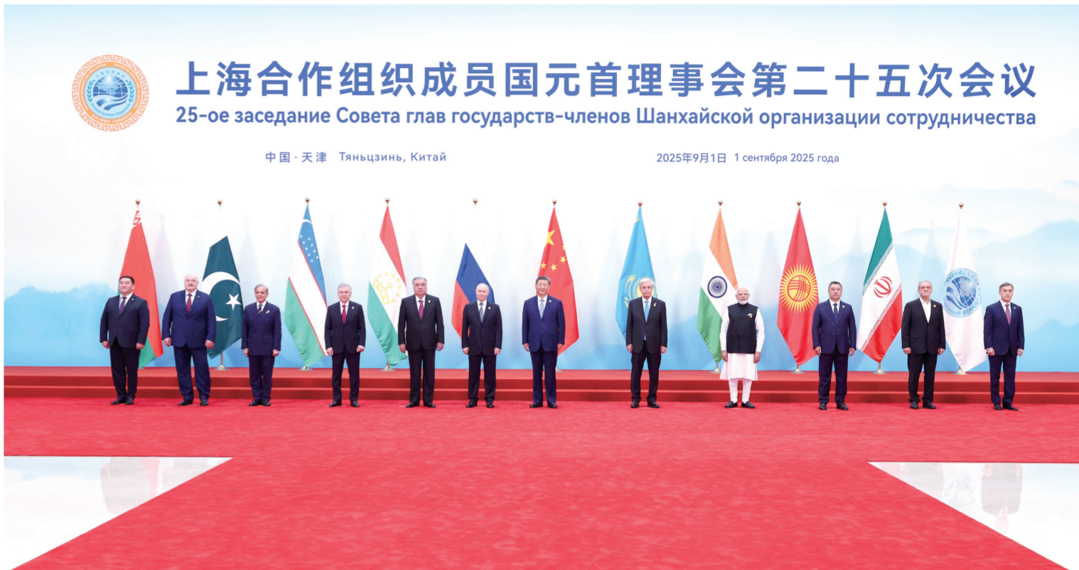
9月1日上午，上海合作组织成员国元首理事会第二十五次会议在天津梅江会展中心举行。中国国家主席习近平主持会议并发表题为《牢记初心使命 开创美好未来》的重要讲话。这是习近平同出席会议的上海合作组织成员国领导人、常设机构负责人集体合影。