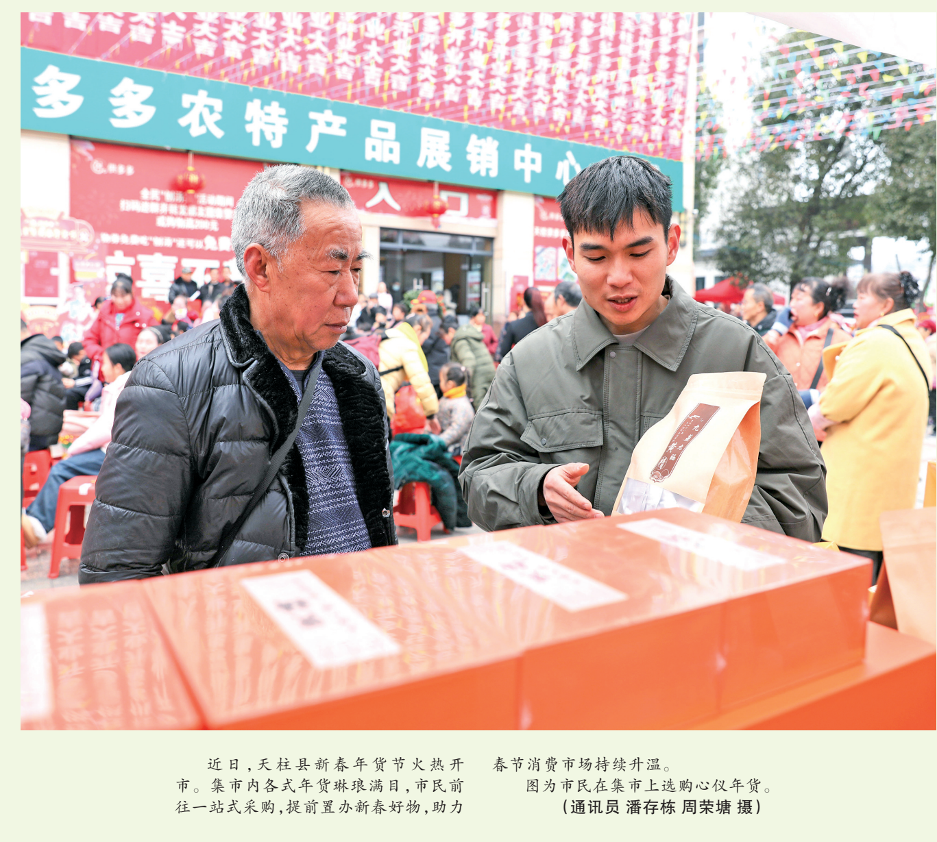
近日，天柱县新春年货节火热开市。集市内各式年货琳琅满目，市民前往一站式采购，提前置办新春好物，助力春节消费市场持续升温。