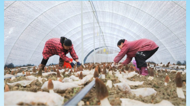
东西部协作资金助力天柱县羊肚菌产业提质增效