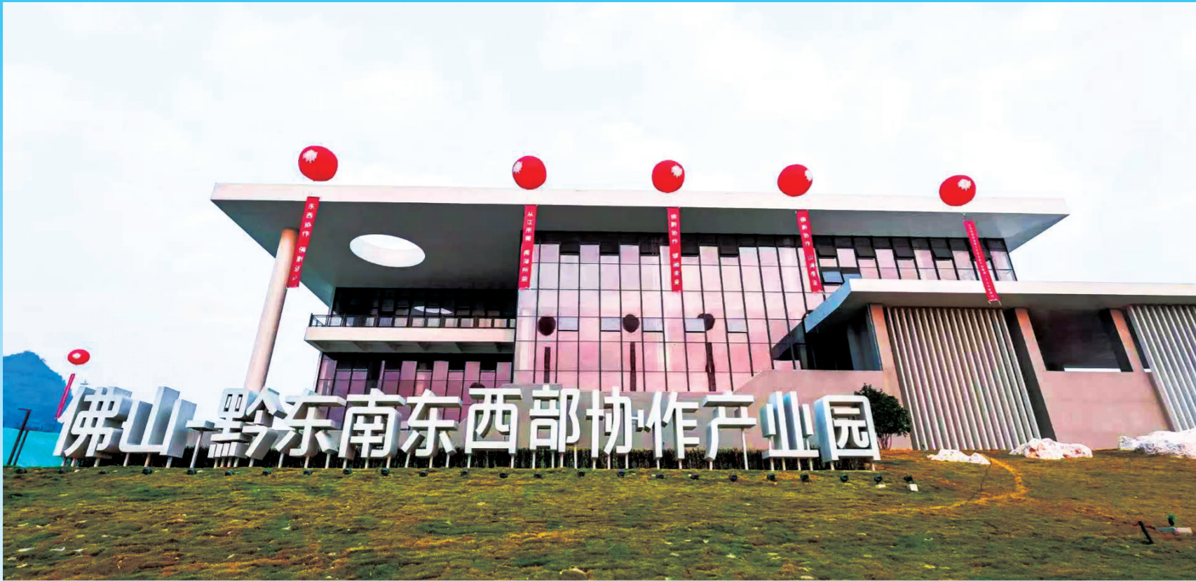
佛山——黔东南东西部协作产业园