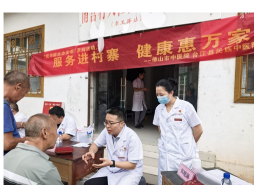
佛山帮扶专家下乡开展义诊