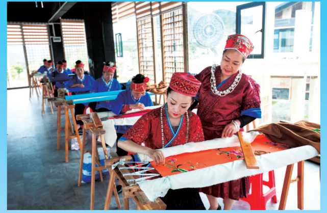
绣娘在舞水云台就业基地创作苗绣