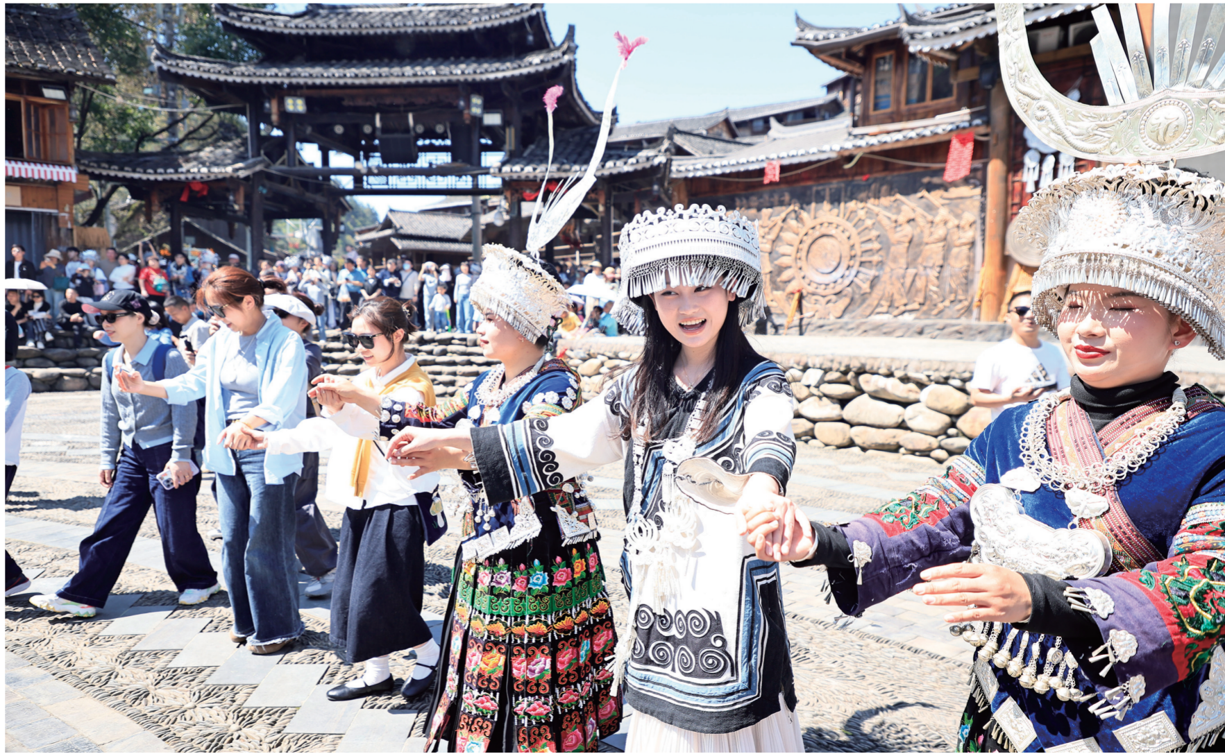
图为游客体验苗族歌舞

一直以来，西江千户苗寨景区始终坚守优质服务初心，以饱满的工作状态、全面的暖心服务迎接八方来客，让广大游客在沉浸式游览中尽享原生态民族风光，感受浓郁民俗魅力，乐享假日休闲时光，在热闹有序的氛围中，收获难忘的春日文旅体验。