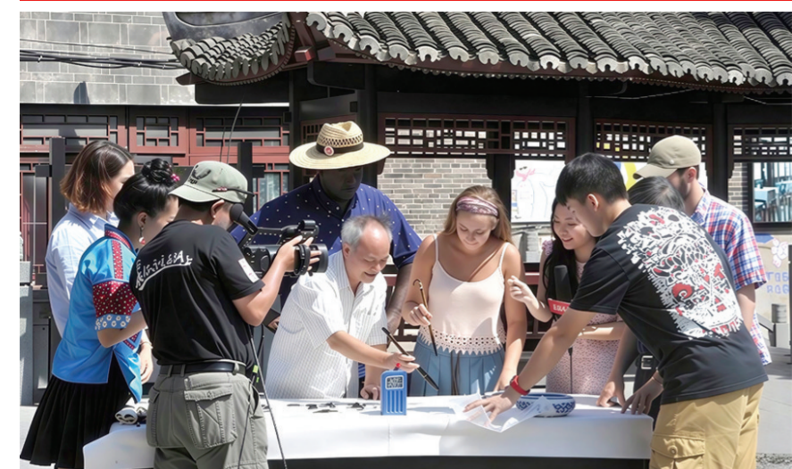
教外国大学生学习中国书法