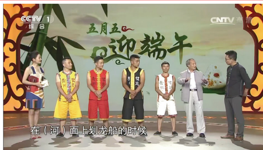
2017年在中央电视台录制节目