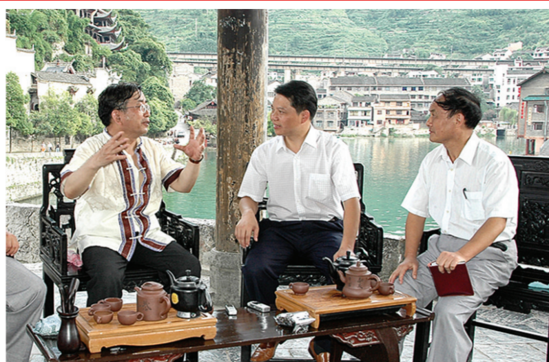
2007年与著名学者余秋雨座谈