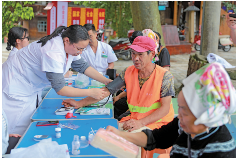
医务人员在雷山县西江千户苗寨景区开展义诊活动