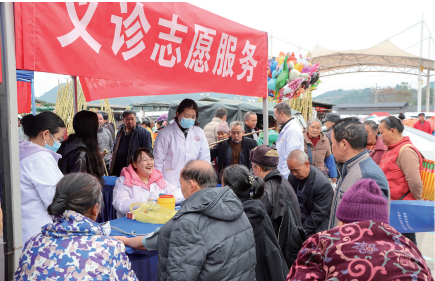
凯里市下司镇卫生院在下司大寨开展义诊志愿服务