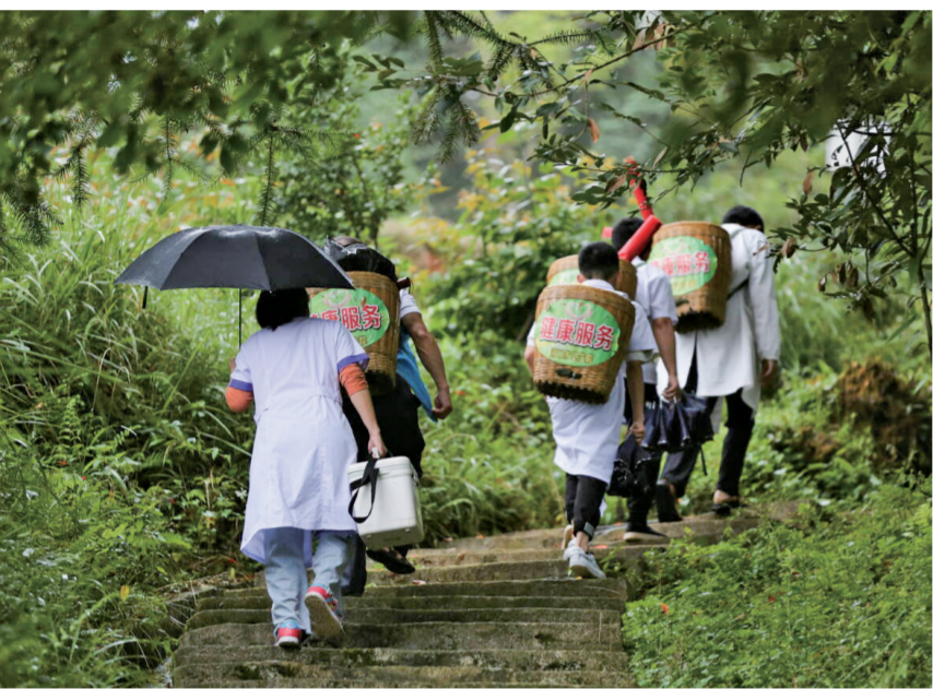
锦屏县河口乡背篓医生健康服务

七十载春华秋实,七十载医润民生。黔东南基层医疗实现跨越式发展,设施、服务、理念全面升级,始终坚守为民初心,持续增进各族群众健康福祉。未来,我们将补齐短板、优化服务,完善医疗体系,深化改革创新,建强人才队伍,传承发展民族医药,全力推动基层医疗卫生事业提质增效,以优质均衡的健康服务守护万家安康,书写新时代健康惠民新篇章。