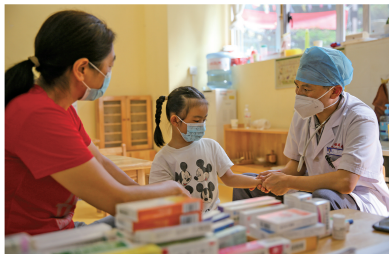
凯里市小区居民在社区卫生室就诊