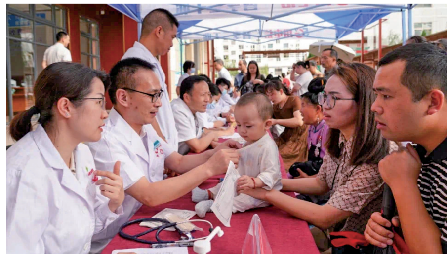
佛山医疗专家在丹寨县人民医院开展义诊活动