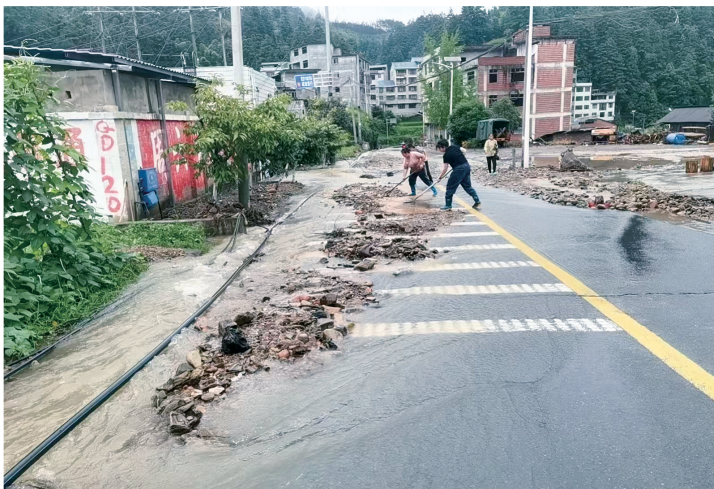
锦屏县启蒙镇便悦村塌方路段,千群同心合力疏通受阻道路。

此次强降雨道路积水险情处置高效稳妥,辖区被困群众全部平安脱险,生命安全得到有效保障。本轮防汛救援中,黎平、天柱两地消防救援队伍闻令而动、联动驰援,不惧风雨坚守防汛一线,以逆行担当筑牢群众生命财产安全防线,切实践行“人民至上、生命至上”的宗旨使命。