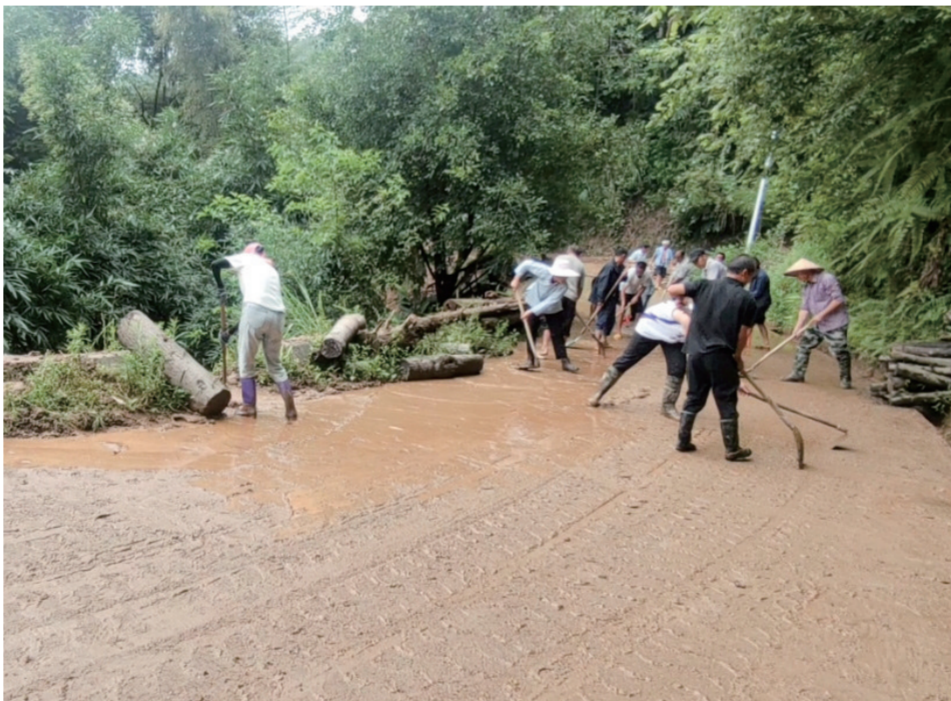
从江县翠里乡凝聚千群合力,全力推进灾后恢复重建工作。