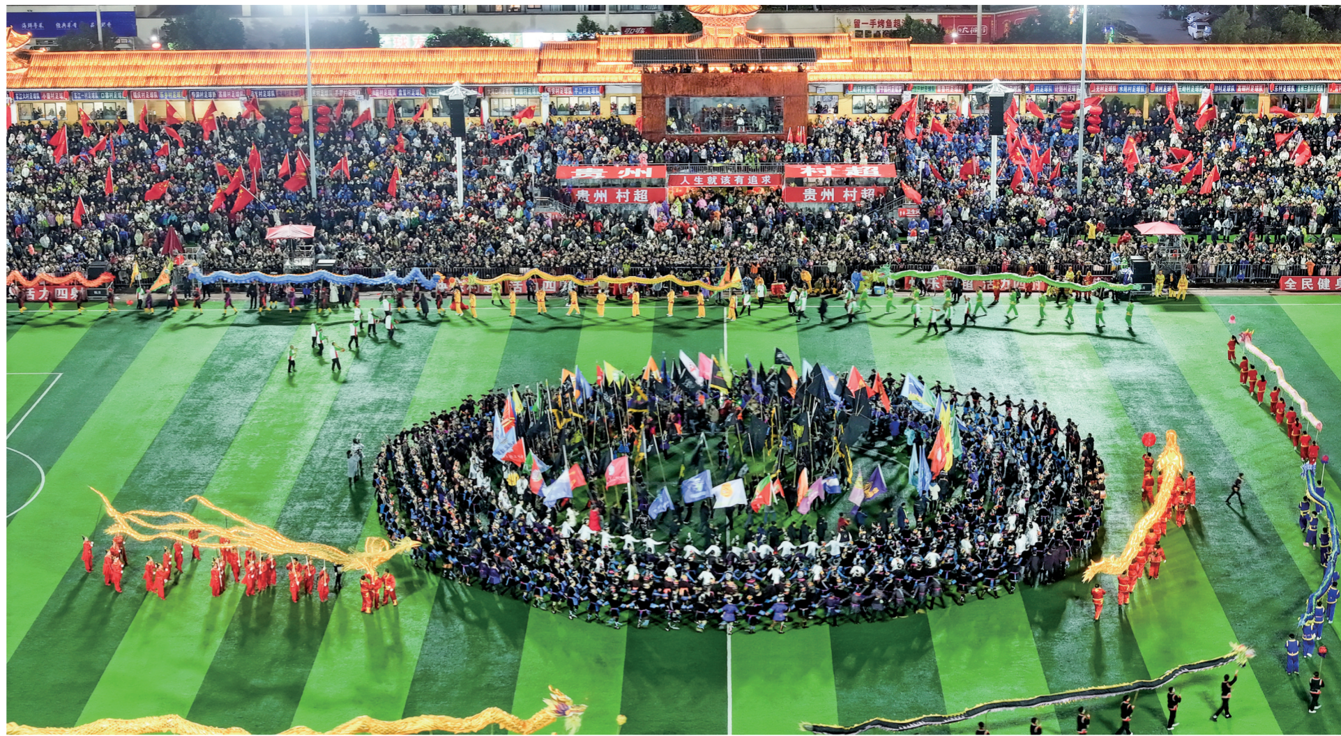
万人聚集“村超村晚”