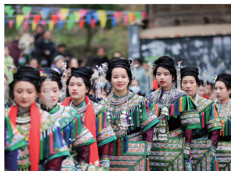
榕江县寨蒿镇晚寨村侗族同胞身着盛装踩歌堂