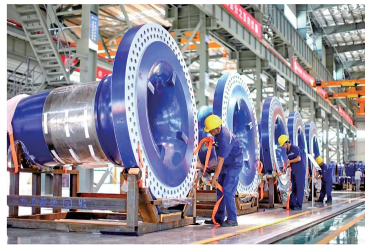
贵州明阳新能源有限公司生产车间