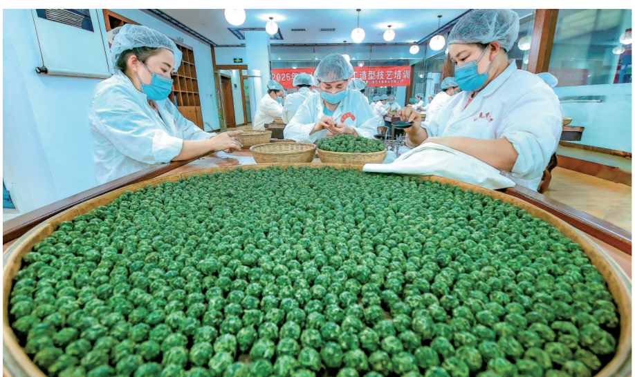
国家地理标志产品雷山银球茶非遗技艺