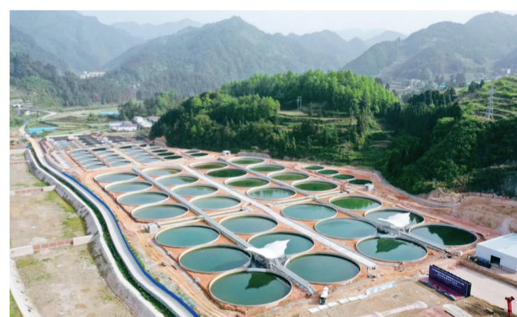
台江碧桂园鲟鳇鱼三产融合示范园