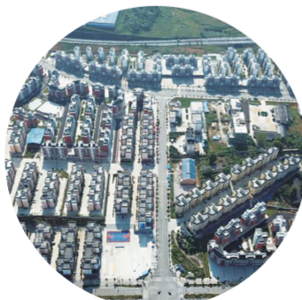
金钟易地扶贫搬迁安置点

五载耕耘,沃土生金;云上丹寨,振兴可期。站在新的历史起点,丹寨县农业农村局将继续发扬伟大脱贫攻坚精神,为谱写中国式现代化丹寨实践“三农”篇章而不懈奋斗。