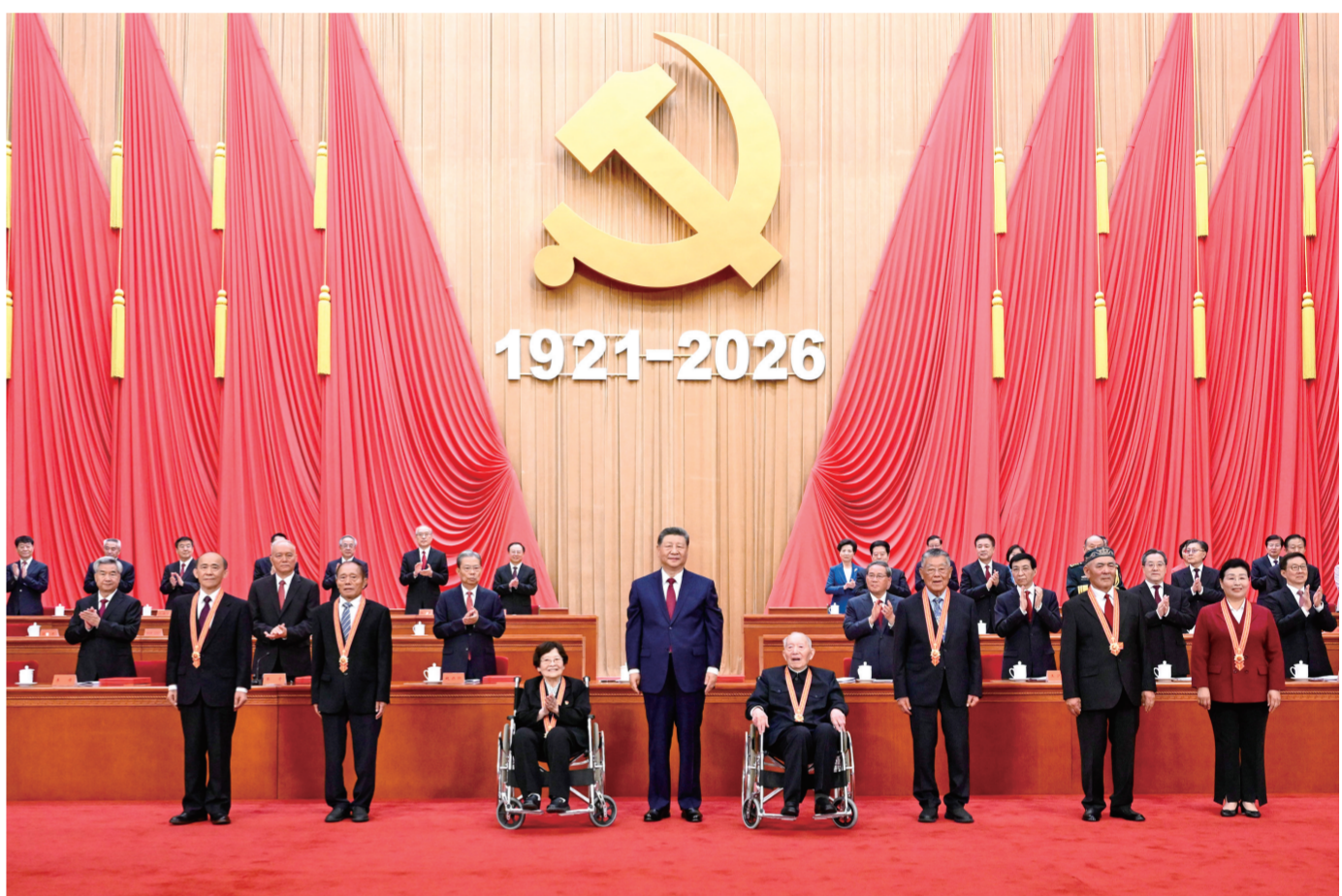
7月1日上午，庆祝中国共产党成立105周年大会在北京人民大会堂隆重举行。中共中央总书记、国家主席、中央军委主席习近平向“七一勋章”获得者颁授勋章。

新华社北京7月1日电 庆祝中国共产党成立105周年大会7月1日上午在北京人民大会堂隆重举行。中共中央总书记、国家主席、中央军委主席习近平向“七一勋章”获得者颁授勋章并发表重要讲话。他强调，105年来，我们党始终坚守为中国人民谋幸福、为中华民族谋复兴的初心使命，在不懈奋斗中创造了彪炳史册的伟大成就。新征程上，全党同志要坚定信心、接续奋斗，不断创造无愧于时代和人民的新业绩。 中共中央政治局常委李强、赵乐际、王沪宁、蔡奇、丁薛祥、李希，国家副主席韩正出席大会。 上午9时许，“七一勋章”获得者集体乘坐礼宾车从驻地出发，由礼宾摩托车护卫队护卫前往人民大会堂。人民大会堂