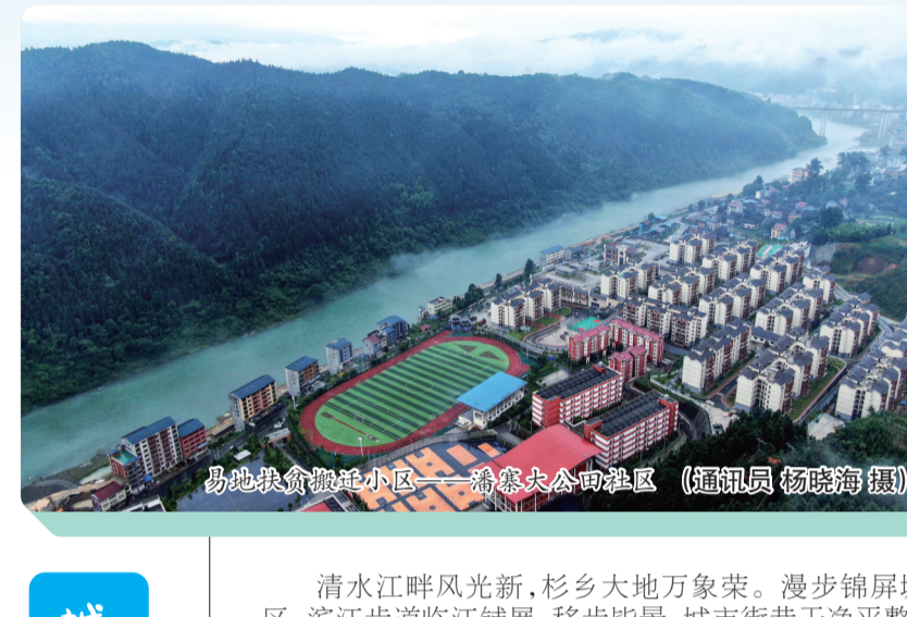
易地扶贫搬迁小区、新建公共服务中心

“我们这一代人读书时,县城到凯里要6个小时,到贵阳至少要8个小时,特别是坐火车的,那简直是煎熬!现在半天就能跑一个来回,那时候想都不敢想。”常年往返于贵阳与家乡之间的李灯明,谈起锦屏交通的变迁,感慨万千。 “以前从村里到县城,山路弯弯绕绕走大半天,现在水泥路修到家门口,开车半个多小时就到了,方便多了!”锦屏县铜鼓镇铜鼓村养蜂能手程昌友,十几年如一日地追着花期跑遍大半个中国。完善的交通路网,让他的蜂蜜坐上专车销往全国各地。“交通方便了,我们的致富路也更宽了!”他笑呵呵地说。 从“山间小路”到“大道通衢”,从“出行难”到“快进快出”,党的十八大以来,锦屏县累计完成交通固定资产投资超42亿元,实现交通事业跨越式发展,彻底打破深山阻隔,为县域发展注入强劲动能。 高速路网从无到有。2015年松从高速锦屏段建成通车,结束县域不通高速历史,实现2小时融入凯里市,2024年剑黎高速建成通车,实现高速快捷衔接周边市县。高速落地极大缩短通行距离和出行时间,实现“出县快、外联畅”,彻底打通县城对外开放主动脉。 国省干线提档升级。“十三五”以来,聚焦国、省道提质改造升级,累计改造S312固本互通至黎平肇隆段升级改造工程、S314黎平肇隆至锦屏八受段路面改造,干线优良路率提升至92%,形成贯穿南北、连接东西的县域主要交通路网骨架。 农村公路全域通达。抢抓“四好农村路”建设机遇,实施通村路硬化、组组通公路项目建设。截至2025年底,全县公路通车总里程达2339.76公里,较黔东南州成立初期增长约23倍,实现县、乡主干道硬化全覆盖、村村通沥青(水泥)路、组组通硬化路。农村公路优良中村路率达85%以上,打通群众出行“最后一公里”。 运输服务持续优化。建成县级客运站1个、乡镇客运站15个、村级招呼站112个,开通城乡客运班线29条,实现村村通客运班线。优化城乡公交运营模式,新增敦寨镇经济开发区至新化乡阳村公交线路,目前已实现李环镇、敦寨镇、新化乡通城乡公交。货运物流网络下沉,建成乡镇物流站点15个,打通农产品出村进城通道,有效解决生鲜、中药材、林下产品运输难题。 交通特色产业,路网围着民生建。锦屏县以交通先行带动特色产业、文旅融合发展,依托清水江生态旅游区、隆里古城、雷屯景区、龙池多彩田园、文斗苗寨等文旅资源,修建旅游观光路、景观步道、产业配套路,打造“路景相融”特色交通。围绕油茶、中药材、生态渔业、精品水果等特色产业,持续推进产业路建设,实现产业基地路网全覆盖。2025年依托完善交通路网,带动新增油茶、锥栗、山核桃种植2.5万亩,精品应季水果种植约12万亩,林下中药材种植7.12万亩,生态养鹅养殖达60余个超100万羽出栏,农产品外销提升65%。 如今,四通八达的交通路网,已成为锦屏县经济发展的“大动脉”,群众致富的“幸福路”。