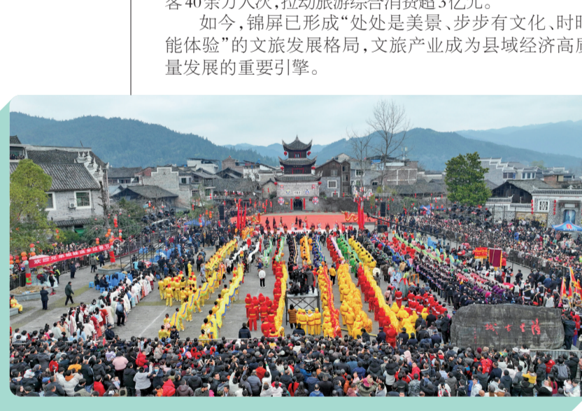
舞龙队在隆里古城表演舞龙

“小姑娘你挑好汉服后,记得要去龙标书院里画花脸,这样搭配更漂亮。”在锦屏县隆里古城,汉服店主杨于福一边为游客挑选服饰,一边热情推介当地特色民俗。这座有着600年历史的明代屯屯古城,依托厚重的军屯文化,融合本土民俗风情,深耕“非遗+旅游”新业态,每逢周末、节假日,街巷游人如织,古屯在烟火气息中焕发全新活力。 “花独放不是春,百花齐放春满园。”五一假期,走进敦寨镇雷屯村,目之所及,街道小巷干净整洁,农家小院错落有致,与一幢幢青砖黛瓦的徽派建筑相映成趣,小河潺潺,百步石桥人来人往,帐篷搭满翠柳沙洲,作为全国生态文化村、国家3A级景区,雷屯村处处呈现一幅百业兴、生态美的和谐画卷。 近年来,锦屏县立足优质生态与深厚文化底蕴,秉持以文塑旅、以旅彰文发展理念,全力推动文化、旅游、体育深度融合,让“藏在深闺”的美景与文化成为县域经济发展的新动能。 文旅根基不断夯实。锦屏旅游基础设施持续完善,成功创建4A级景区1个,3A级景区3个,盘活龙标多彩田园、隆里古城、隆里古镇镇城综合景区3个。建成四星饭店锦都酒店、金山级民宿匠庐·耕读第,完善景区旅游标识体系、游客服务中心、旅游厕所等配套设施,旅游服务体系不断健全。“十四五”以来,累计接待游客1307.66万人次,旅游花费126.53亿元。 文化薪火代代相传。锦屏木商文化底蕴深厚,红色基因赓续传承,非遗更是百花齐放。全县现有国家级非遗10项,省级20项,州级27项,县级80项,铜鼓刺绣入选国家级非遗;锦屏文书列入《中国档案文献遗产名录》,成功入选《世界记忆亚太地区名录》申报后备案。建成州级以上单位挂牌的非遗展示馆、传习所、传习基地、非遗工坊共计11个,常态化推动“非遗进校园”“非遗进社区”,组织非遗项目亮相村组、村BA、“村晚”,让民族文化焕发新生机。 文旅业态推陈出新。打造苗族风情体验、侗族文化探秘、汉文化研学三条主题旅游线路,发展“非遗+研学”“民俗+旅游”“节庆+体育”等新业态。推出《隆里六百年》实景情景剧,还原隆里从筑武戎边到文脉延续的六百年变迁,打造隆里古城文旅融合的核心IP。举办锦屏四十八寨歌节、“七二〇”赶歌节、摆古中、中秋民族歌等民族节庆,承办2025年全国春节“摆古”示范展示活动,各族群众在共庆节日、共享文化中增进情感认同。 以“羽”为媒促进文旅融合。锦屏县常态化举办羽毛球赛事,吸引全国各地各民族羽毛球爱好者齐聚锦屏,同场竞技,以球会友。赛事期间同步开展民歌巡游、非遗展演、长桌宴等民族文化活动,让赛事成为联结各民族情谊、促进民族团结的重要纽带。“十四五”期间,累计举办各类羽毛球赛事近千场,参赛运动员5万余人次;亚狮龙产业园接待各界参观学习近20万余人次,实现体育制造向观光旅游延伸。系列赛事带动全县核心景区新增游客40余万人次,拉动旅游综合消费超3亿元。 如今,锦屏已形成处处是美景、步步有文化、时时能体验”的文旅发展格局,文旅产业成为县域经济高质量发展的重要引擎。