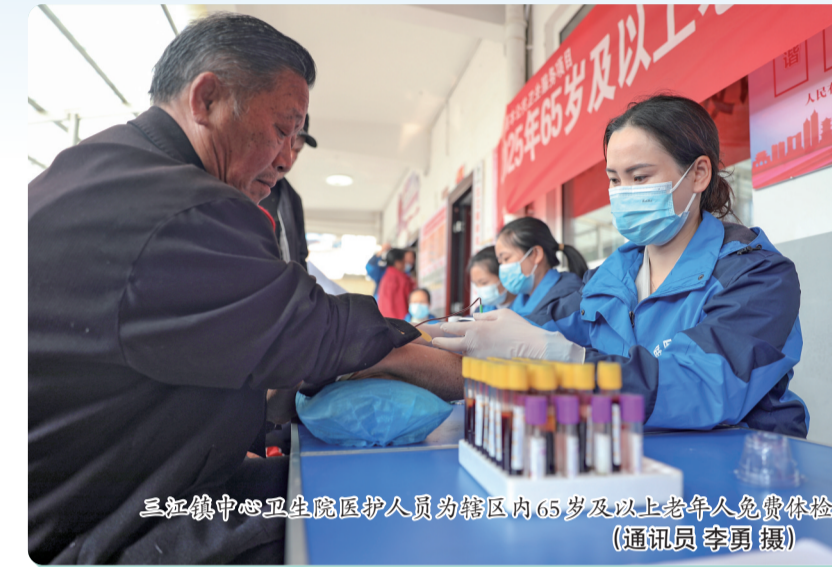
县融媒体中心工作人员为辖区内65岁及以上老年人免费体检

七十年栉风沐雨,新时代步履铿锵。站在自治州成立70周年的新起点上,锦屏县将继续以习近平新时代中国特色社会主义思想为指导,不忘初心、牢记使命,攻坚克难、锐意进取,持续推动产业提质、城乡提质、民生提质,治理提质,奋力谱写锦屏高质量发展新篇章,为黔东南州经济社会发展贡献更大锦屏力量。